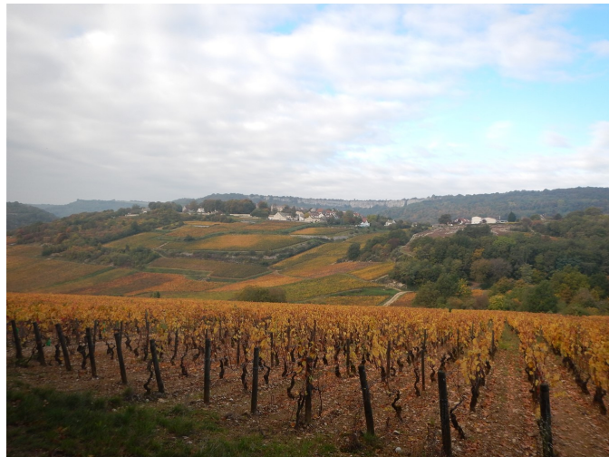
Vignes à Meursault

Actuellement le club compte 50 licenciés et nous serions heureux de vous accueillir parmi nous. Ci-après notre calendrier pour 2016. Le départ a toujours lieu à 8h30, parking de l'église de Belleherbe (sauf le 6 mars, départ à 9h30).