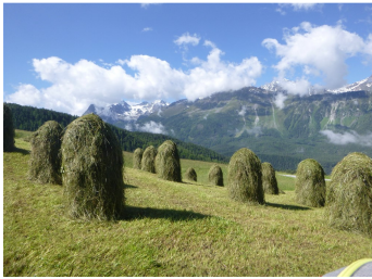
Meules de foin sur échelas Tyrol

A partir du dimanche 8 mars, nous avons repris tous les quinze jours les randonnées, qui nous ont conduits successivement à Belfort, Rougemont, le Dessoubre, Besançon, la source du Lison, Damprichard, Remonot, les tourbières de Frasné, Grand Combe des bois, Vandoncourt, la Chaux de fonds, Goumois et Meursault.